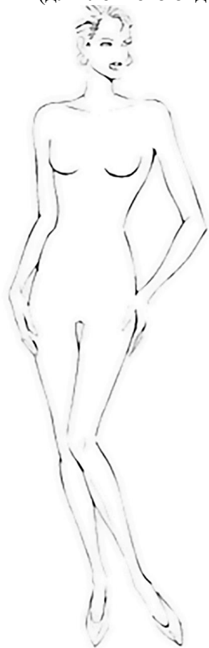
Модель 1 (для летнего отдыха)